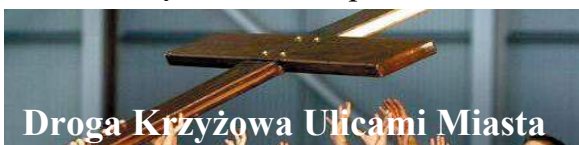
19 00 Droga Krzyżowa Ulicami Miasta